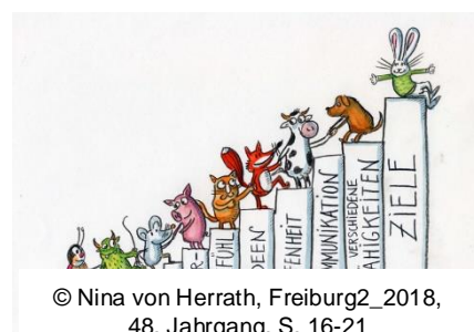
© Nina von Herrath, Freiburg2_2018, 48. Jahrgang, S. 16-21

Das Team setzt sich aus 11 pädagogischen Fachkräften unterschiedlichster pädagogischer Ausbildungen zusammen. Hinzu kommen Praktikanten und Praktikantinnen verschiedenster Ausbildungsgänge. Wir schöpfen aus der Vielfalt der Qualifikationen und das macht unsere Arbeit so abwechslungsreich und hochwertig. Unsere Zusammenarbeit im Team ist geprägt durch Vertrauen, Respekt, einander ergänzenden Fähigkeiten,